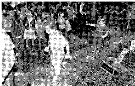
L'orto urbano inaugurato in occasione di «Reggio Narra» nella scuola dell'infanzia 8 Marzo